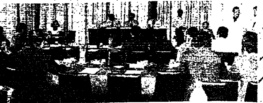
الامين العام لجمعية الصليب الأحمر الفلسطيني في الضفة الغربية